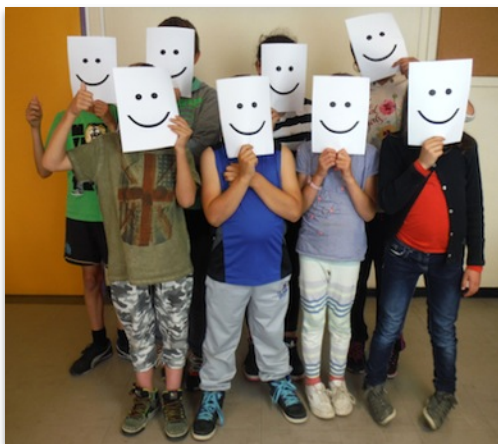
Photo de groupe des enfants participant au projet « Portraits masqués »

Le projet « Botanicus » est une autre situation concrète puisqu'il montre et fait entendre des membres du photo club qui savaient qu'ils seraient pré-