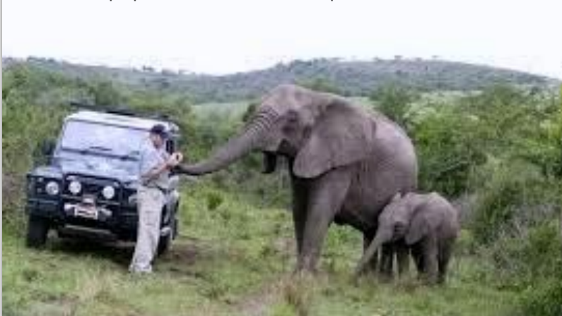
L'homme qui parlait à l'oreille des éléphants

Tous ces commentaires vont me permettre de passer un niveau tant technique qu'artistique qui me permettra, peut-être, de représenter le club lors de concours régionaux. Merci à tous pour votre aide précieuse qui me permet de franchir un cap dans la conception de ce diaporama et des diaporamas en général. »