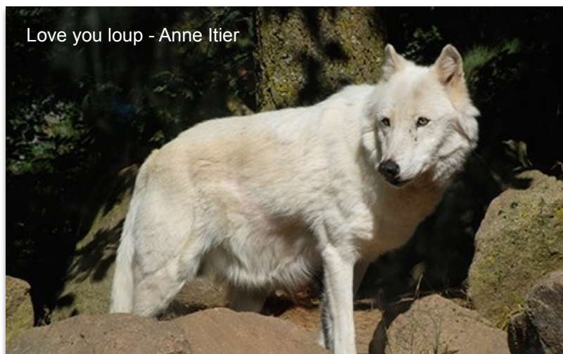
Love you loup - Anne Itier

Les échanges qui ont suivi ont essentiellement porté sur l'émotion ou le ressenti des spectateurs, et surtout sur les problèmes techniques auxquels chacun a pu se trouver confronté : la taille des caractères des titres, l'utilisation du zooming dans les différents plans, le traitement du son, la taille des images.